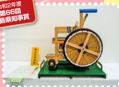
坂、平坦走行切り換え装置付車椅子機構 二本松市 日下部 準