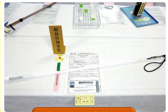
令和元年度 県知事賞受賞作品 水たまりを知らせる白杖 (福島市立北信中学校 2年)