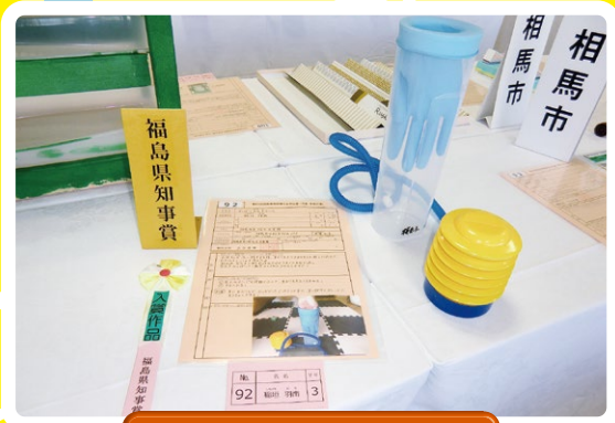
令和元年度 県知事賞受賞作品 すっぽり空気手ぶくろ (相馬市立桜丘小学校 3年)